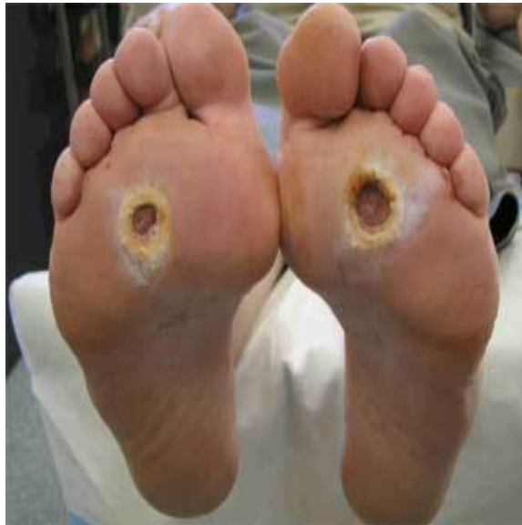
پمفلت آموزش مددجو

❁ بدون استفاده از ضد آفتاب در معرض نور خورشید قرار نگیرید. ❁ اگر پایتان میخچه یا پینه دارد، خودتان برای برداشتن آنها اقدام نکنید و اجازه بدهید پزشک آنها را بردارد. ❁ به طور منظم جهت معاینه به پزشک مراجعه کنید.